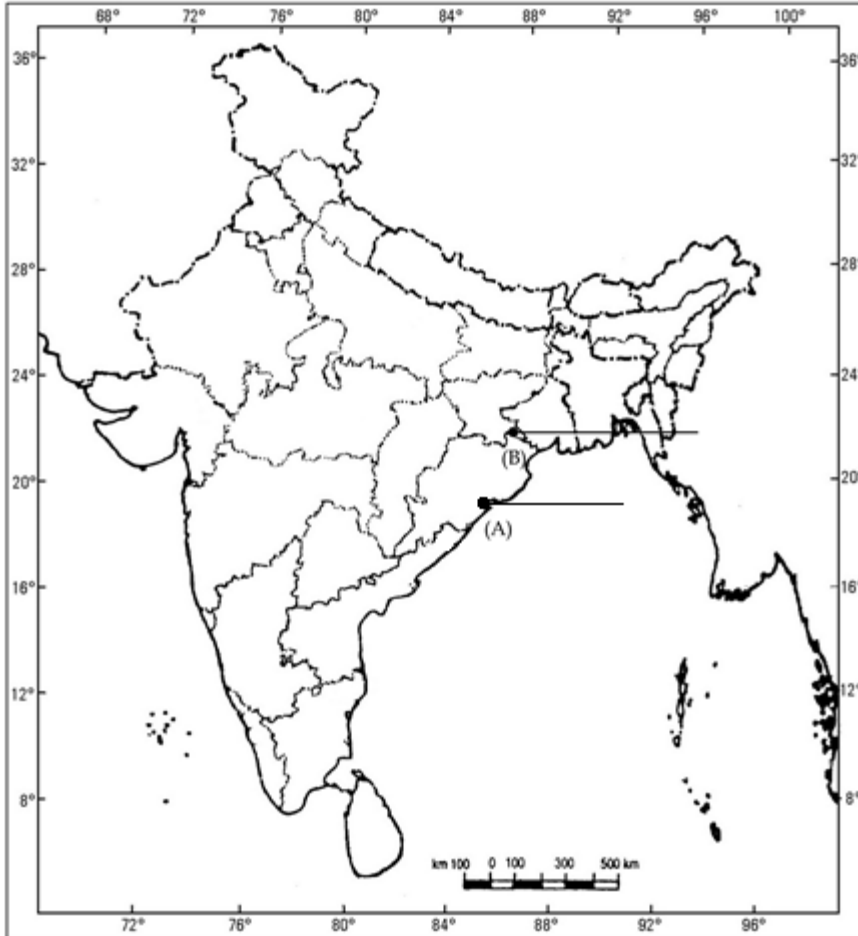
Political Map of India

(30.3) In which state is Tarapur nuclear power plant located ?